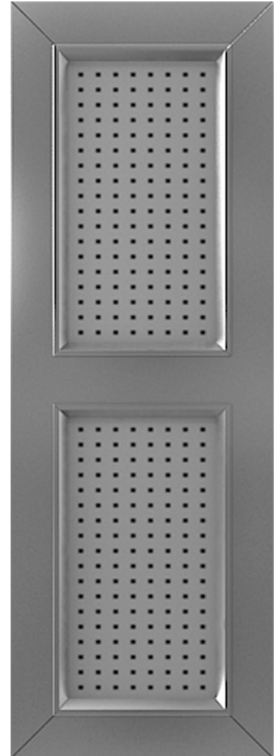
Abb. zeigt Typ AB 100 mit Querfriß (Mehrpreis)